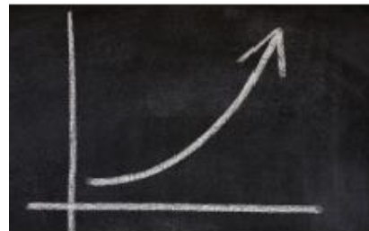
Resultat- og læringsrelatert